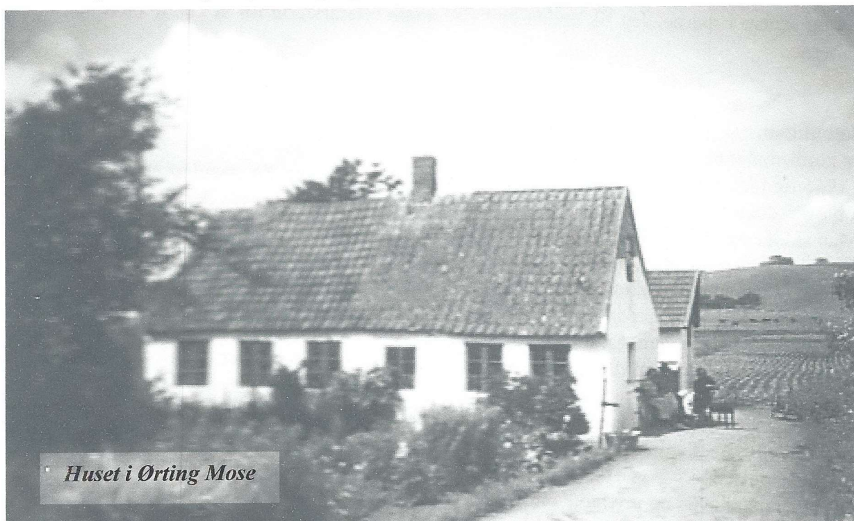
Huset i Ørting Mose

blev ikke gravet særlig meget. En gang imellem kom en mand med en hestevogn og hentede et